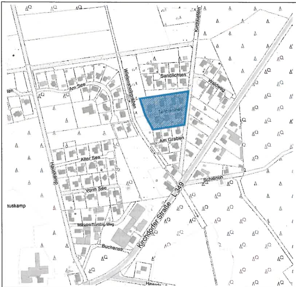
Geltungsbereich des Bebauungsplanes Nr. 1 - 5. Änderung (ohne Maßstab)

In der nachfolgenden Übersichtskarte ist die Lage der 5. Bebauungsplanänderung im zusammenhängenden Siedlungsbereich abgebildet.