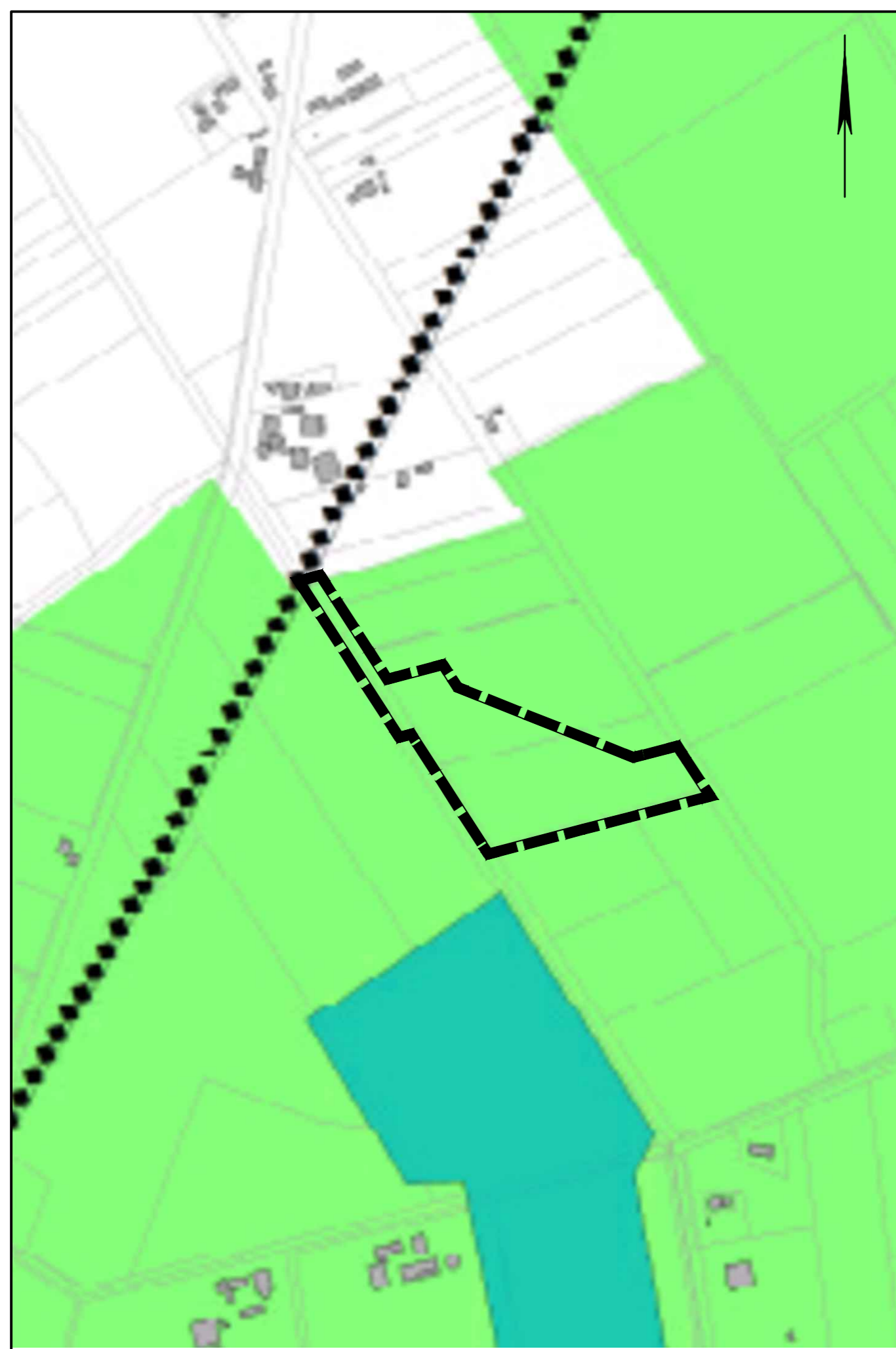
Aktuell geltender Flächennutzungsplan