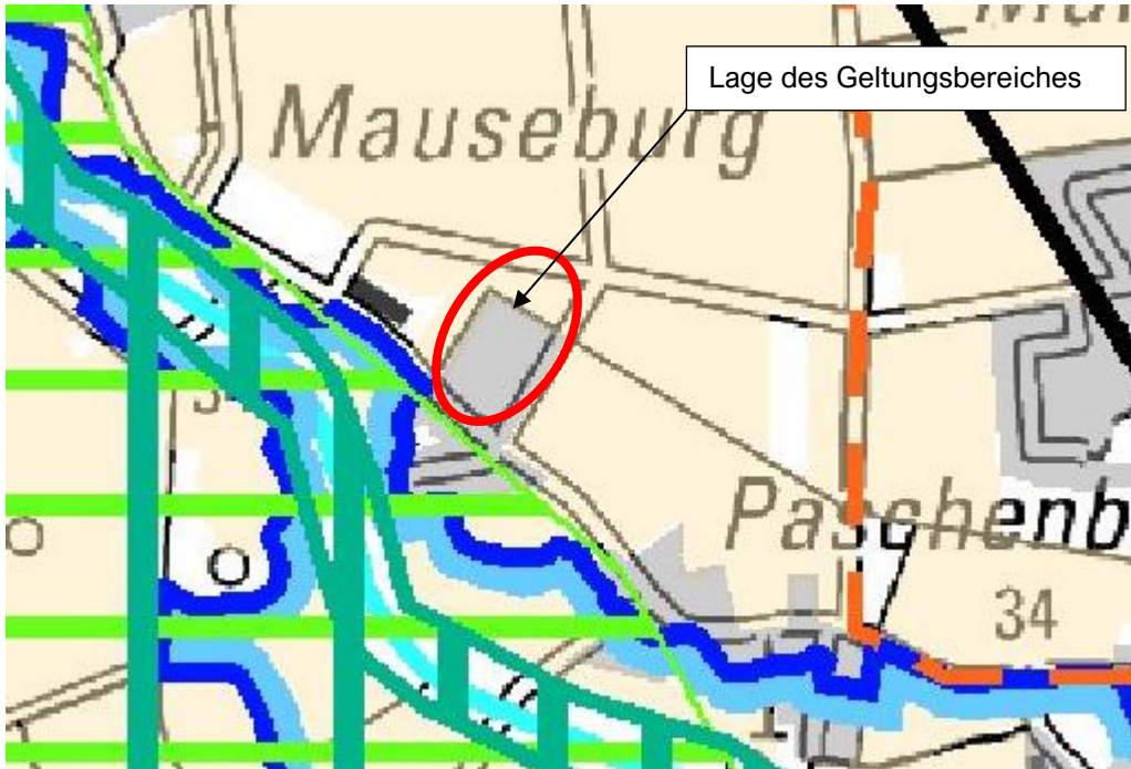
Abbildung 2: Ausschnitt RROP Landkreis Diepholz

Das Regionale Raumordnungsprogramm (RROP) des Landkreises stellt den südwestlichen Bereich als Vorhandene Bebauung / Bauleitplanerisch gesicherten Bereich, den nordöstlichen Bereich als Vorbehaltsgebiet Landwirtschaft – aufgrund hohen Ertragspotenzials – dar. Südwestlich der Straße Paschenburg werden ein Vorbehaltsgebiet Erholung, ein Vorbehaltsgebiet Natur und Landschaft, das Gewässer Kleine Aue als ein Vorranggebiet Natur und Landschaft und ein Vorranggebiet Hochwasserschutz dargestellt. Nordwestlich, nordöstlich und südwestlich grenzen weitere Vorbehaltsgebiete Landwirtschaft an den Geltungsbereich an.