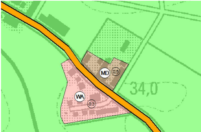
Abbildung 1: Ausschnitt aus dem Flächennutzungsplan der Samtgemeinde Kirchdorf