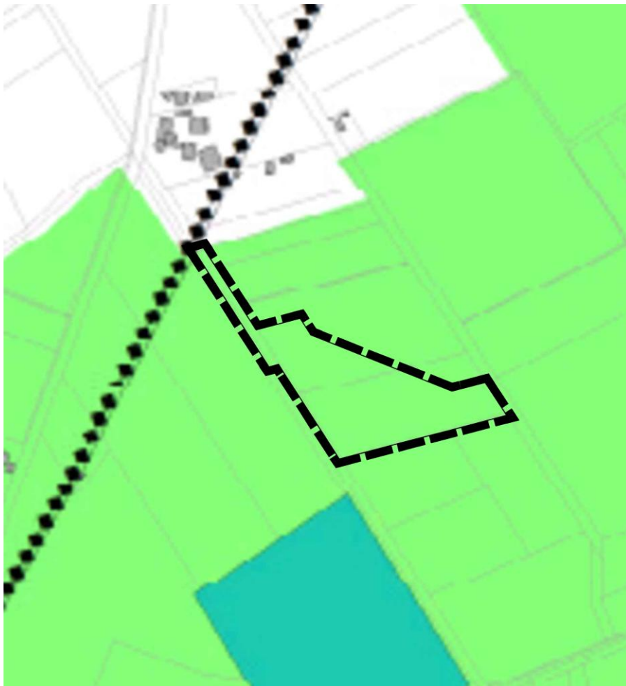
Ausschnitt F-Plan Samtgemeinde Kirchdorf mit Darstellung Änderungsbereich (Collage IPW)

Diese Darstellung lässt die vorgesehene Entwicklung von Übernachtungsmöglichkeiten in Kleinsthäusern im Einklang mit der Natur nicht zu. Der aktuell gültige Flächennutzungsplan der Samtgemeinde Kirchdorf wird daher gemäß den definierten Planungszielen geändert. Der Änderungsbereich wird zukünftig als sonstiges Sondergebiet mit der Zweckbestimmung „Ferienhäuser und Wohnmobilstellplätze“ gemäß § 11 BauNVO sowie als Grünfläche ausgewiesen.