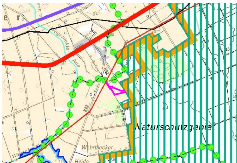
Ausschnitt aus dem RROP für den Landkreis Diepholz

Im Hinblick auf die Energieübertragung im Höchstspannungsnetz mit einer Nennspannung von mehr als 110 kV ist sicherzustellen, dass die in der zeichnerischen Darstellung als Vorranggebiete Leitungstrasse festgelegten Leitungstrassen gesichert werden.