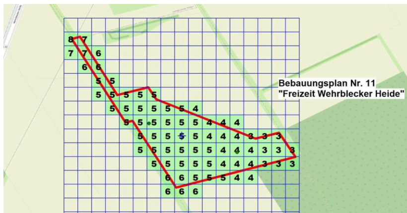
Gesamtbelastung an Geruchsimmissionen (FIDES Jan. 2026)