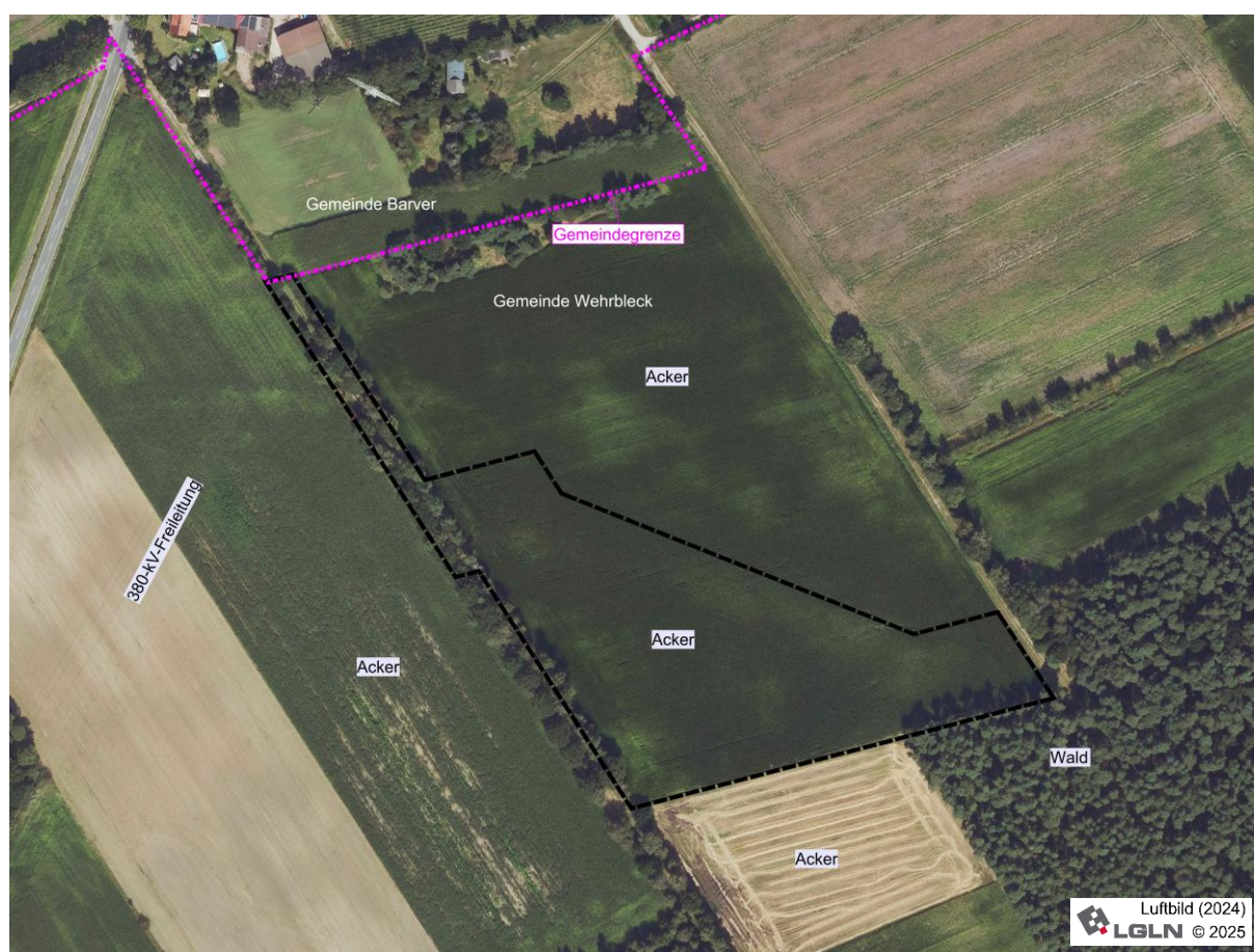
Luftbild (Bildflug 2024) mit Geltungsbereich

Bis auf die Wegeparzelle wird der Änderungsbereich derzeit intensiv landwirtschaftlich genutzt (Ackerland). Der Wirtschaftsweg ist beidseits von Gehölzen gesäumt.